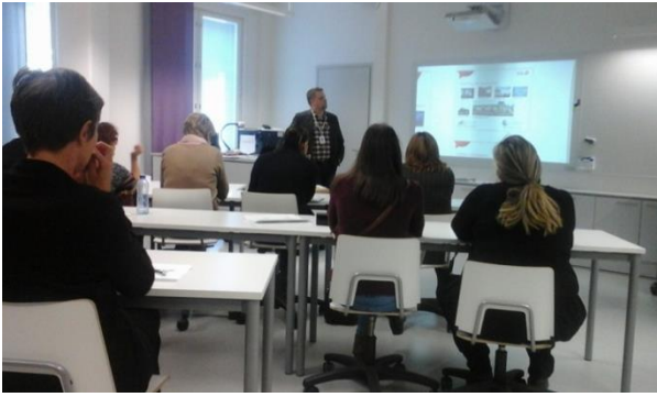
Foto de la izquierda: el director de uno de los centros educativos más grandes y modernos de Finlandia visitados (Kastelli community Centre) mostrándonos la metodología de trabajo que su equipo docente lleva a cabo.

trabajo cooperativo de los profesores con sus grupos de alumnos (se juntan dos clases del mismo nivel o diferentes para realizar actividades conjuntas donde los profesores y alumnos se ayudan unos a otros).